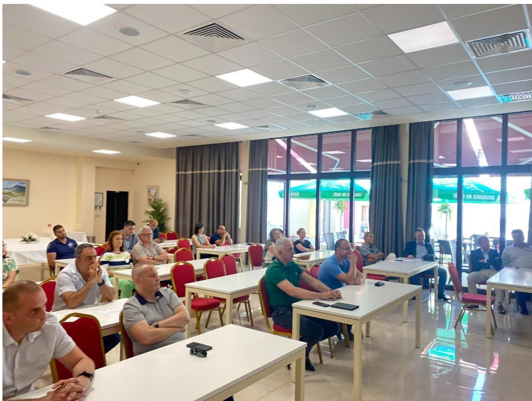
Първа кръгла маса „Декарбонизация“ в град Трявна на 28/06/2022 г.