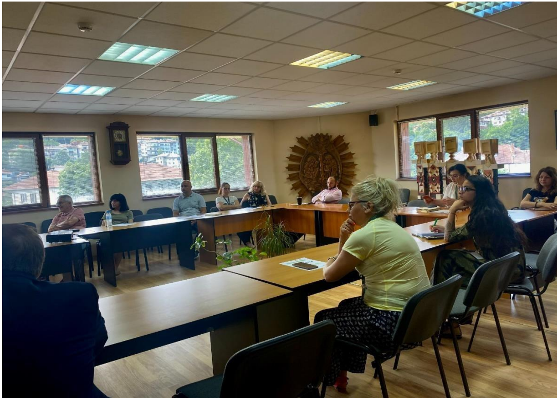
Втора кръгла маса „Децентрализация на енергийния сектор в България“ в град Костинброд на 20/10/2022 г.